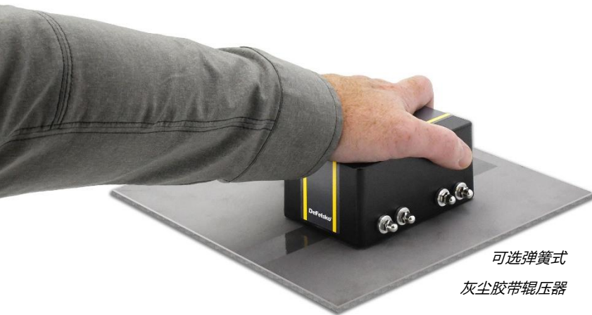
可选弹簧式 灰尘胶带辊压器

符合 ISO 8502-3, AS 3894.6, US Navy PPI 63101-000 标准